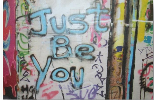
"הִי/הָּיִי אֶת/הָּ עֲצַמְךָ"