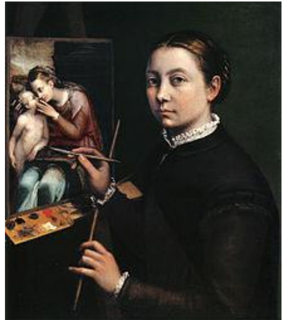
סופונזיבה אנגוויסולה (1530-1625), פורטרטים עצמיים עם ספר ועליו שמה ודיוקן עצמי כציירת (יצירות שהן נחלת הכלל לעניין זכויות יוצרים)