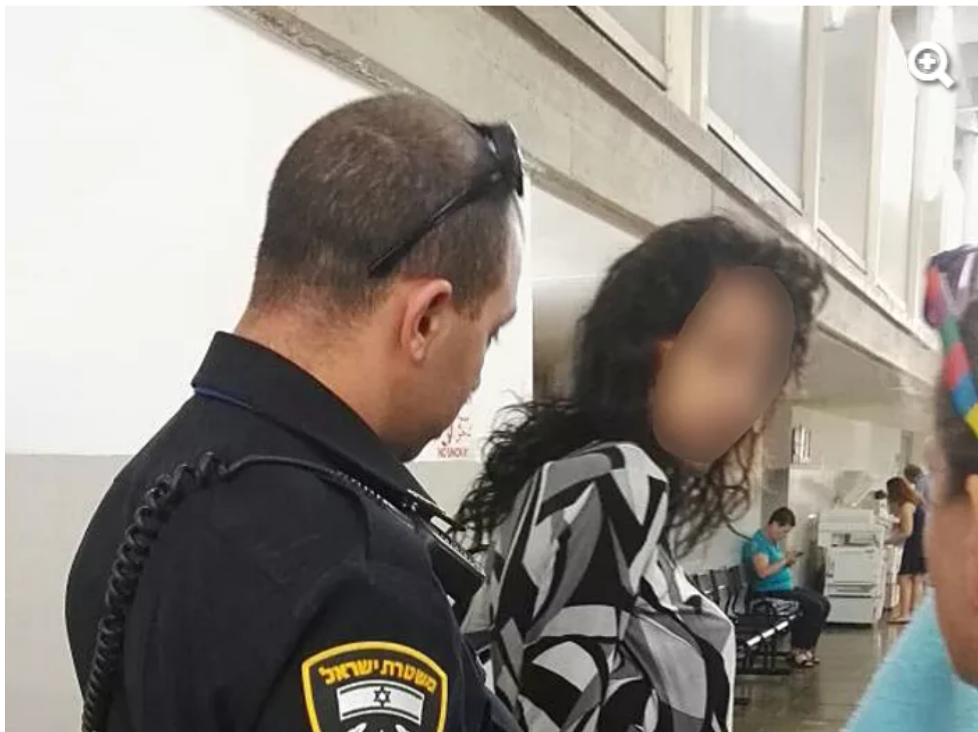
"הזעקתי את המשטרה, שלא באה". בית המשפט השלום בתל אביב, היום

רמי סדן לוואלה! NEWS: "הדברים לא נאמרו, על עלילה לא מתפטרים" הנאום של יועצת אובמה מבהיר: המשבר עם ארצות הברית עוד כאן לראשונה: ראש תשתית להברחת מהגרים מהים התיכון הוסגר לאיטליה