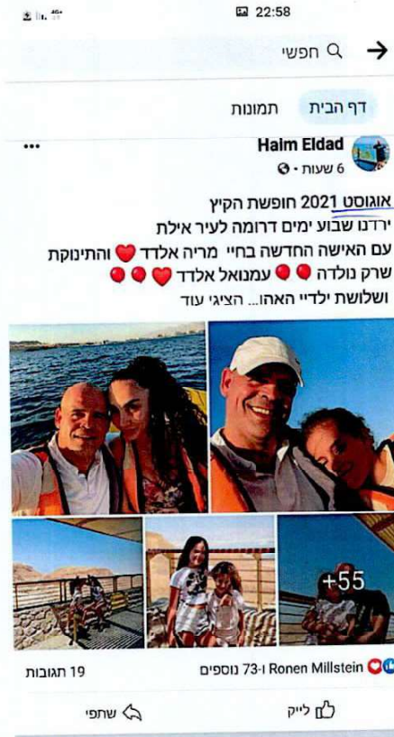
חופשה בויליאם 15.8.2021-19.8.2021

חיים מתקל להתחיל ולהתחיל ללא שנינו התחיל אך בלבב אהבים אנו לא סתמו לבנות אהבי שקום בתמי לתיא אך אהבנו להתקדם יא אבא הונה אבא עולה... אבא (אין ויאנו לבו!) יוצא לחופשה יתרה (כאן קבב הוציא 2 חופשה בחול אהב) אך אינו משלם ואני לקח את אהבתי!