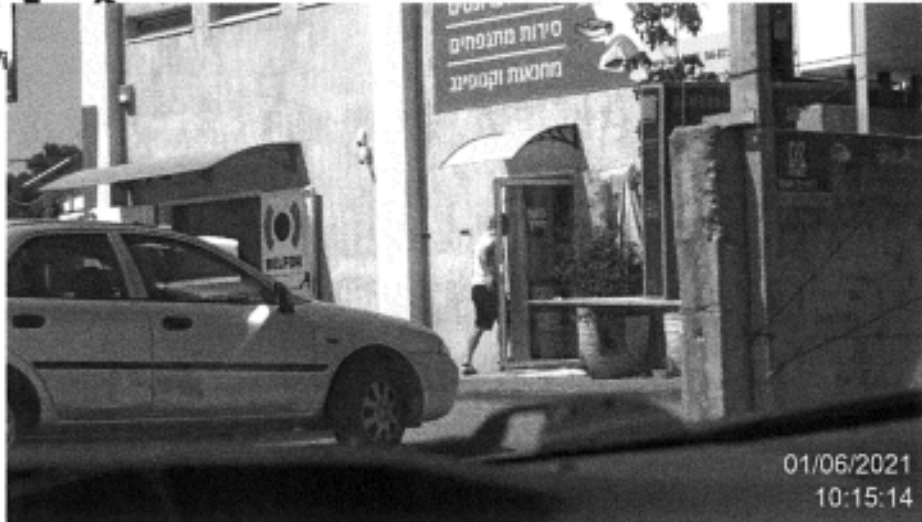
הנדון תועד מגיע לבית העסק "הכול לים" בדרך חיפה 19 קריית אתא.