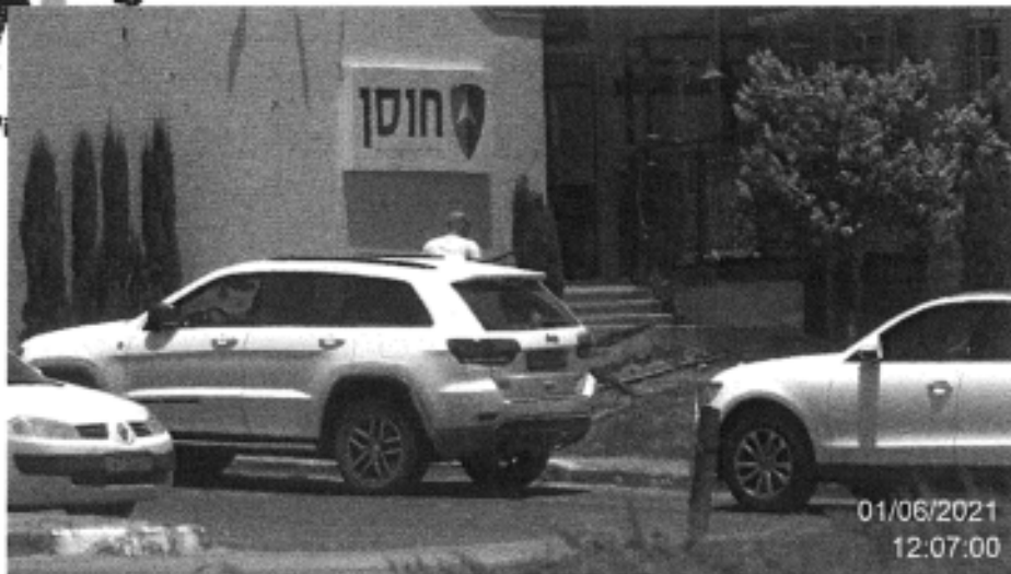
הנדון מגיע לחברת "חוסן" בכניסה לקיבוץ מזרע לביצוע ניכיון שקים אותם לקח מ"פוטוגרפיקס"