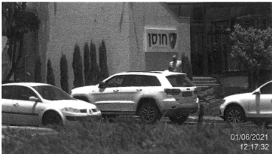
הנדון ביציאה מחברת ניכיון השקים "חוסן"