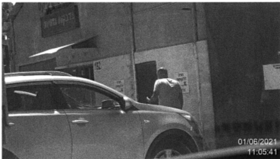
הנדון מתועד נכנס לבית העסק "פוטוגרפיקס" ברחוב שדרות ההסתדרות 192 חיפה.