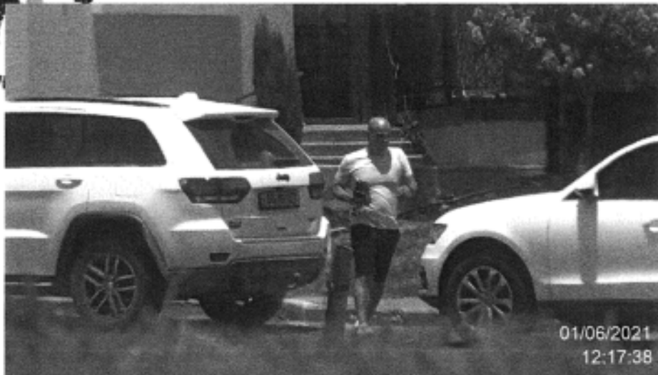
הנדון בסמוך לרכבו אוזח בידיו ככול הנראה שטרות כסף במזומן אותם קיבל מחברת "חוסן"