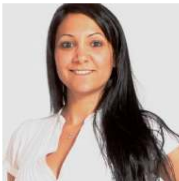
עו"ד סופר בסרגליק