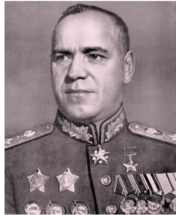
הגנרל ז'וקוב 2

בתום סקירה קצרה על מצב העניינים בכל החזיתות והצגת הערכות אודות המגמה האסטרטגית של הגרמנים הציע ז'וקוב לתגבר באופן מיידי את החזית המרכזית סביב מוסקבה על חשבון המערכה להגנה על אוקראינה והעתודות במזרח הרחוק. "ומה בנוגע לקייב?" שאל סטלין. "קייב תפונה!" ענה ז'וקוב אשר ידע מהו הצליל הנורא שיהיה באותם ימים למילים 'נוותר על קייב' באוזני העם הסובייטי, ובייחוד באוזני סטלין. "על מה אתה מדבר? מה השטויות